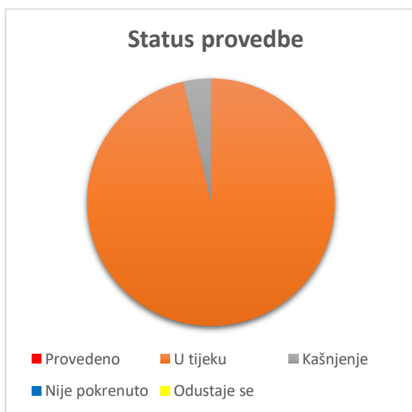
Grafikon 1. Prikaz mjera prema statusu provedbe u 2024. godini