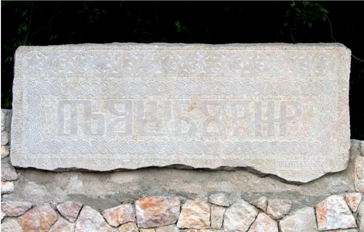
Slika 1: Glagoljski natpis na ulazu u Dobrinj.

Najznačajniju privrednu odrednicu tijekom srednjeg vijeka svakako predstavlja solana u uvali Soline podno Dobrinja; u to doba sol je bila vrlo tražena i cijenjena. Osvojivši otok, Mlečani zatvaraju solanu, ali su njezini ostaci jasno vidljivi i danas.